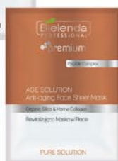
Rewitalizująca maska w płacie