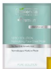
Normalizująca maska w płacie

Idealne połączenie z Aktywnymi Koncentratami MESO MED PROGRAM Bielenda Professional