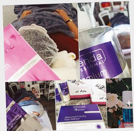
Salon Urody Jolanta