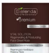
Regenerująco- nawilżająca maska w płacie