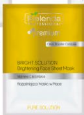
Rozjaśniająca maska w płacie